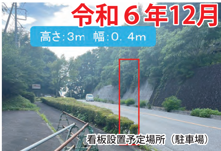
看板設置予定場所 (駐車場)