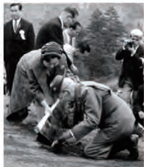
香淳皇后お手植えの様子

また、平成25年11月には、皇太子殿下御臨席のもと、第37回全国育樹祭もここ金尾山で開催され、全国植樹祭