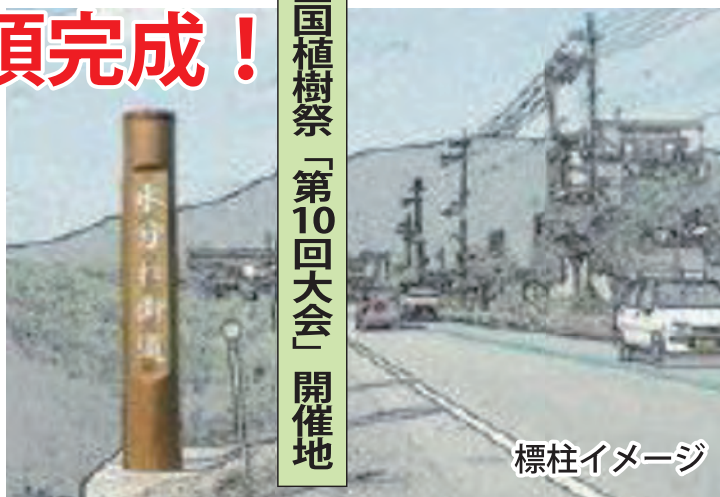
全国植樹祭「第10回大会」開催地