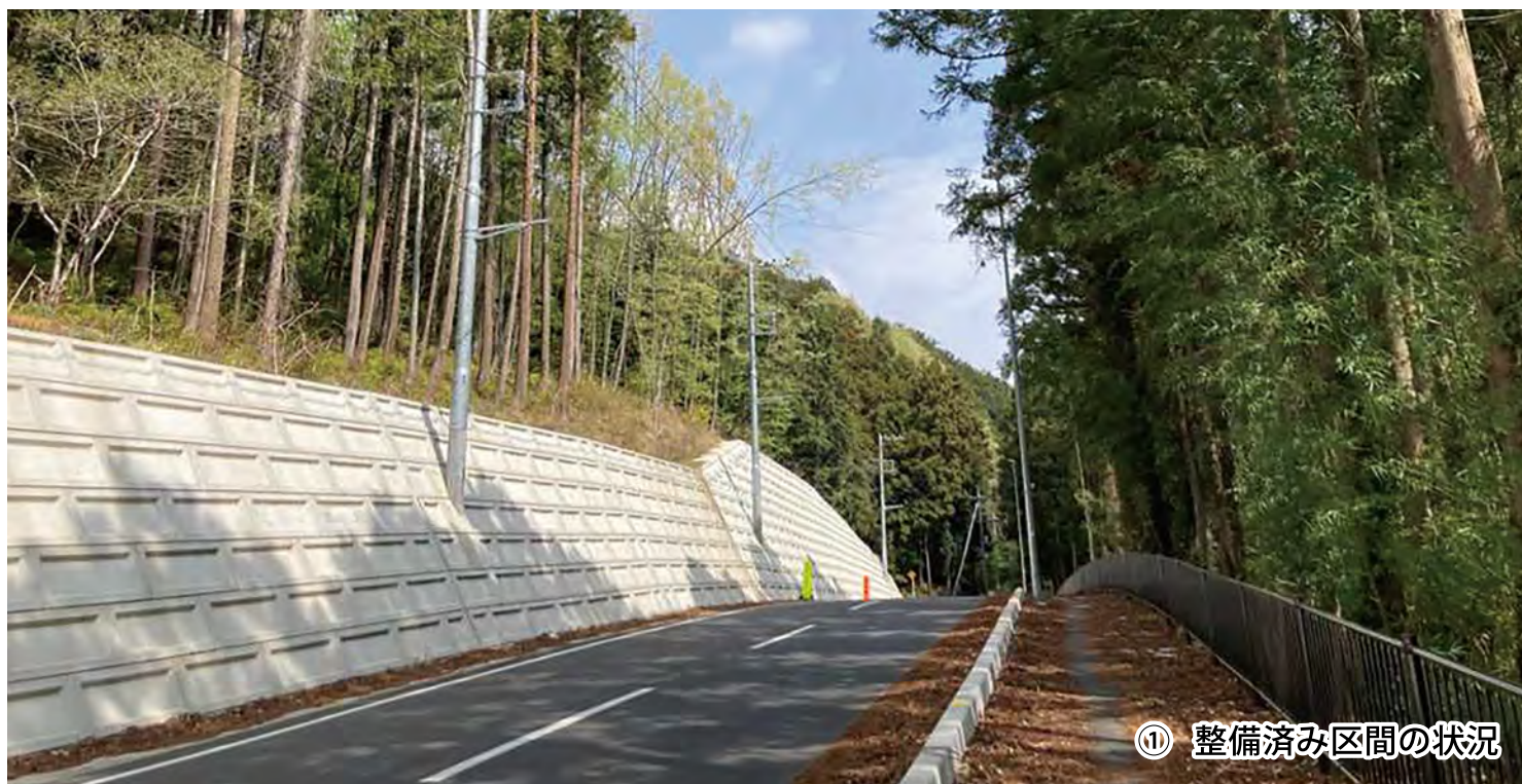
① 整備済み区間の状況