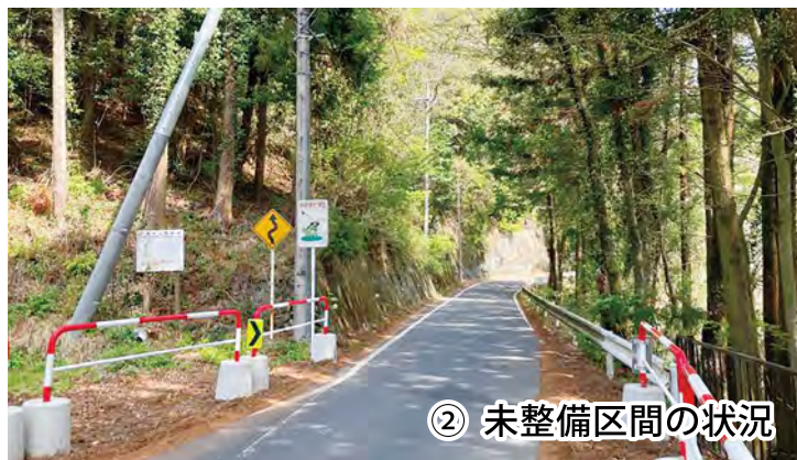
② 未整備区間の状況