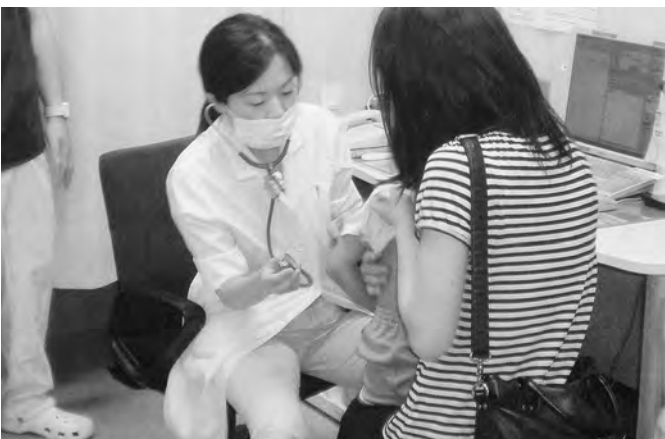
小児医療センターからの派遣・医師による小児医療の