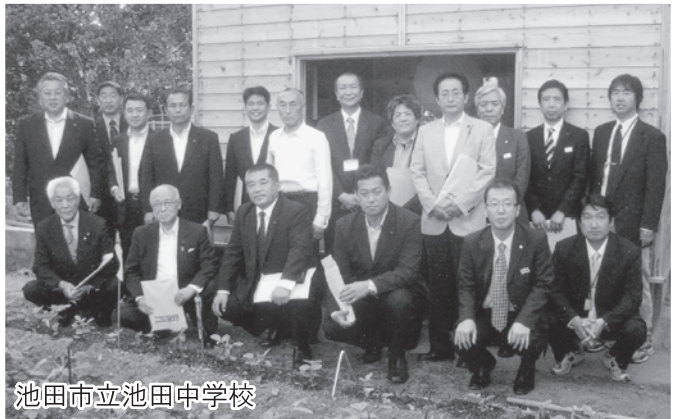
池田市立池田中学校