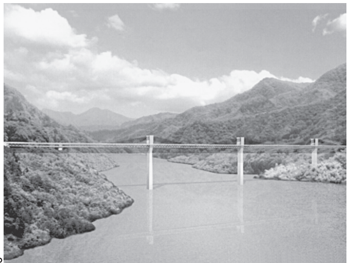
▲上流方向から下流方向を望んだ八ッ場ダム完成予想図

埼玉県が八ッ場ダムによる利水上あるいは治水上の利益を受けないとは認められず、負担金等の支出は適法とし、原告の訴えを棄却又は却下した。