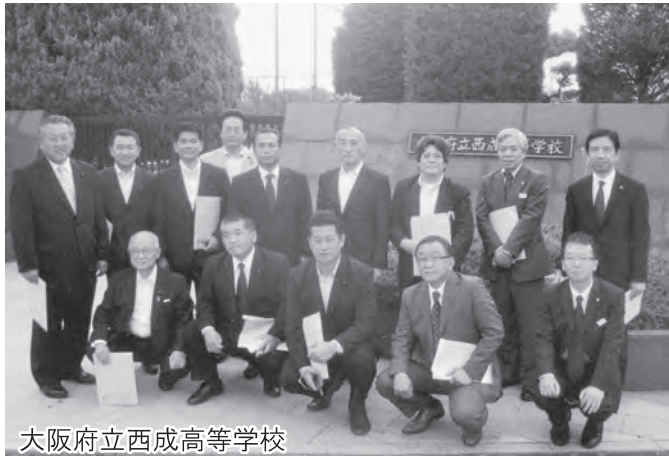
大阪府立西成高等学校

県議会文教常任委員会で大阪市、京都市、神戸市を訪問。公立の中学・高校と私立小学校を視察いたしました。