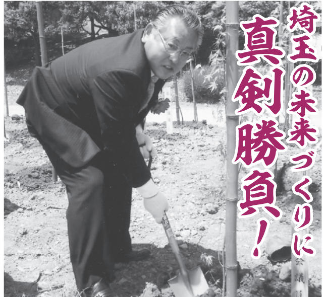
埼玉県植樹祭 5月16日(日)本庄市内

補正予算としては 62億1,131万1千円 となり、 既定予算との累計額は、 1兆6,826億2,131万1千円 となります。