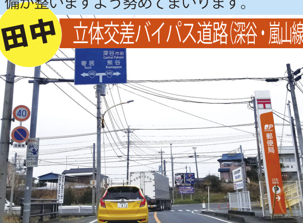
田中 立体交差バイパス道路(深谷・嵐山線)

国道140号バイパスから武川交差点までの約1.1キロメートル区間(一部区間供用開始)について、秩父鉄道との立体交差を含むバイパス整備を進めております。一日でも早く整備が整いますよう努めてまいります。