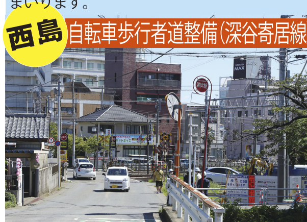
西島 自転車歩行者道整備(深谷寄居線)

狭かった深谷駅西側踏切の県道深谷寄居線(西島地区)の自歩道整備工事がいよいよ開始されました。この地域の皆さまが、安全で安心して暮らせるよう今後とも精一杯取り組んでまいります。