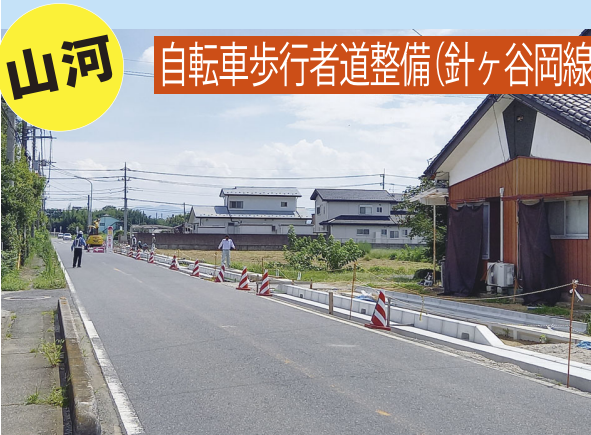
山河 自転車歩行者道整備(針ヶ谷岡線)