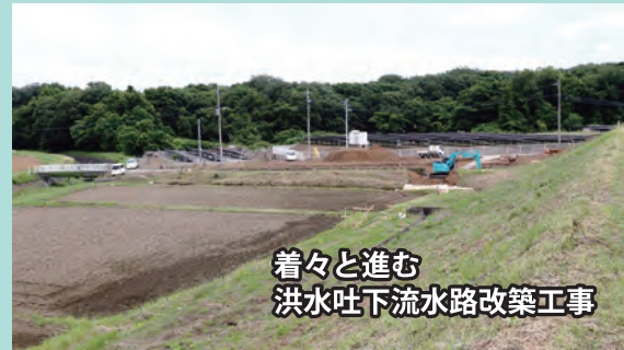
着々と進む 洪水吐下流水路改築工事

5月31日土地改良事業のエキスパートである、自由民主党参議院議員進藤金日子議員に、川本地区芳沼の現地視察にお越しいただきました。残念ながら私は県議会の臨時会出席のため参加できませんでしたが、進藤議員には芳沼の農地防災事業(ため池改修)と芳沼用水土地改良区の現状を視察していただき、芳沼用水土地改良区からのほ場整備事業実施を要望させていただきました。