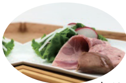
ハム・ソーセージ