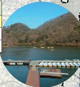
⑫県営農地防災事業【桐ヶ谷池】