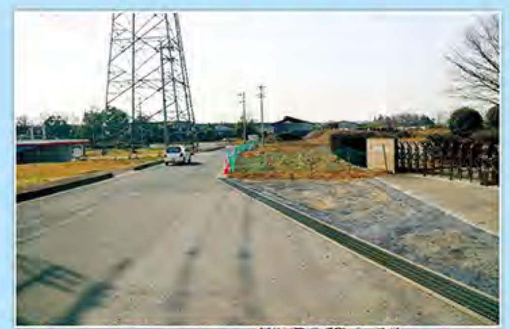
道路改築 (花園本庄線)

安心安全を実現し災害に強い埼玉づくり 首都圏を支える埼玉県へ 豊かな暮らしを実現する埼玉づくり