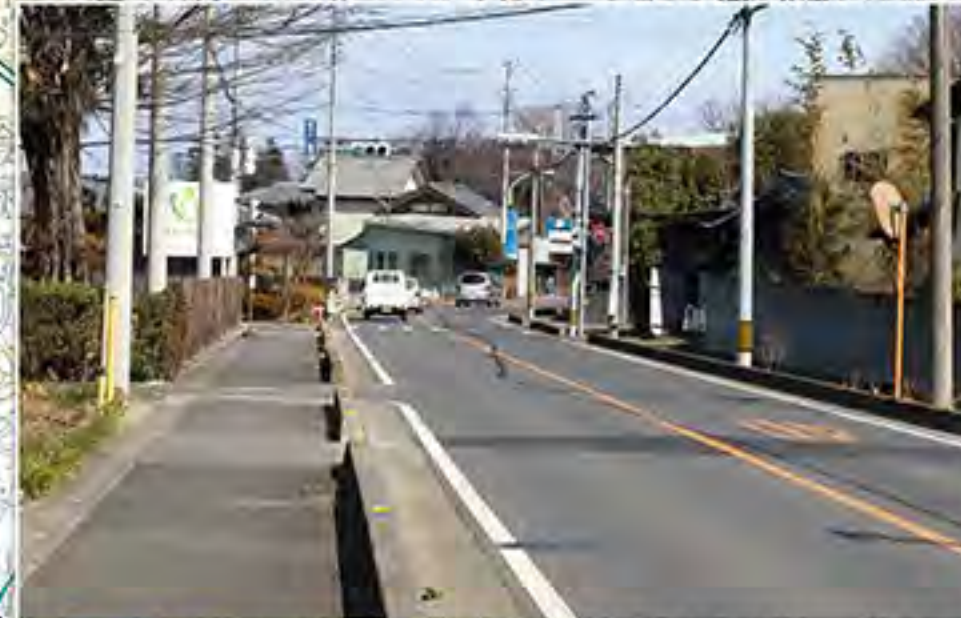
歩道整備 (深谷寄居線)