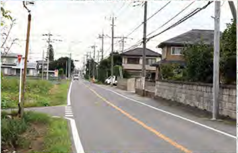
歩道整備 (針ヶ谷岡線)