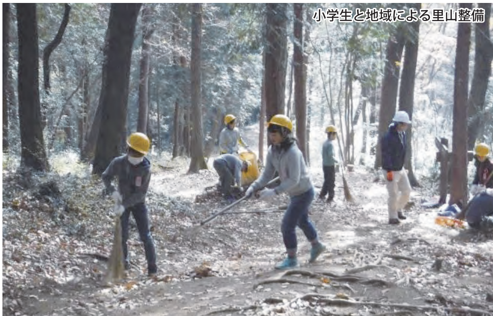
小学生と地域による里山整備

地球温暖化の防止、水源のかん養、生物多様性の保全など森林の有する公益的機能の維持増進、生活に潤いと安らぎをもたらす身近な緑の保全及び創出、環境教育の推進等を県民参加の下に図り、本県の豊かな自然環境を守り育てるため、彩の国みどりの基金を活用し事業展開を図ります。